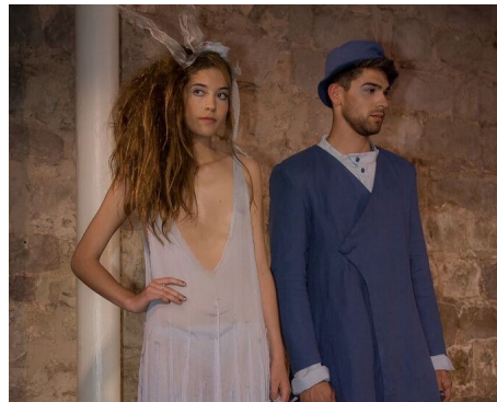
Els vestits estan inspirats en l'obra d'artistes com Picasso i Brossa.